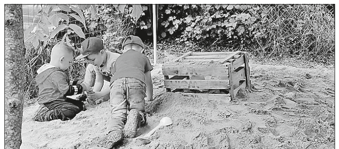
Auch unsere kleinen Gäste hatten großen Spaß.