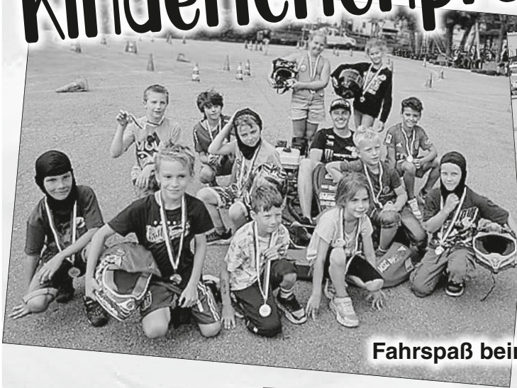
Fahrspaß beim Kartfahren