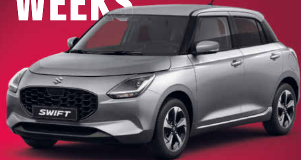
Abbildung zeigt aufpreispflichtige Sonderausstattung.