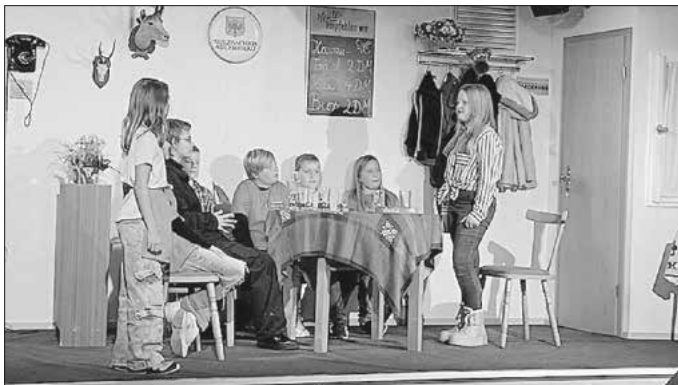
Die Feuerwehr beratschlagt über das weitere Vorgehen beim aktuellen Brand, der ungeschickter Weise während des Stammtisches ausbricht.

Ein herzliches Dankeschön an alle, die gekommen sind und an die zahlreichen Helferinnen und Helfer, die zum Gelingen des Nachmittags beigetragen haben!